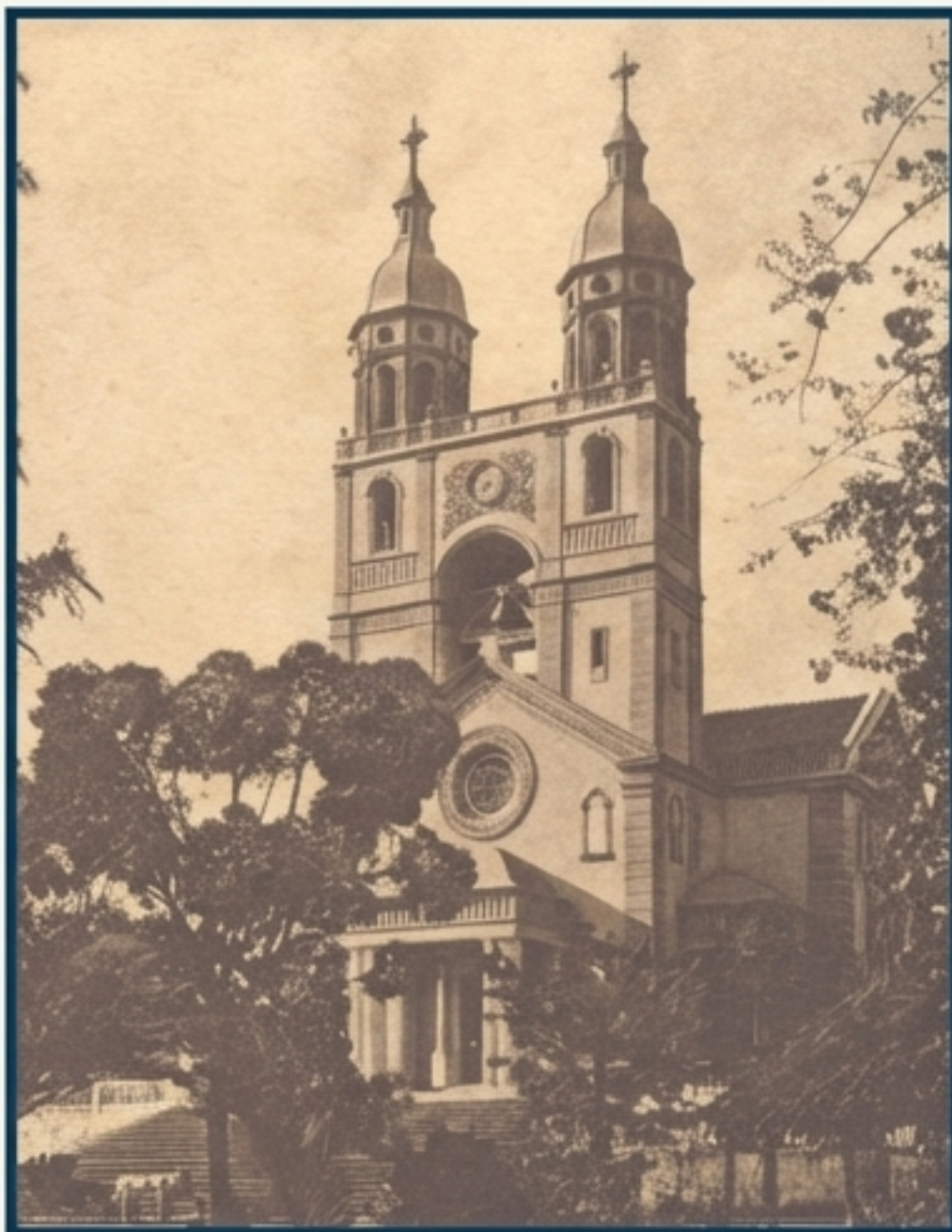
A Catedral Metropolitana de Florianópolis vista da praça.

Da imponente Catedral à Alfândega e ao Palácio do Governo, o acervo é um verdadeiro álbum de memórias dos marcos arquitetônicos que definem a identidade da capital.