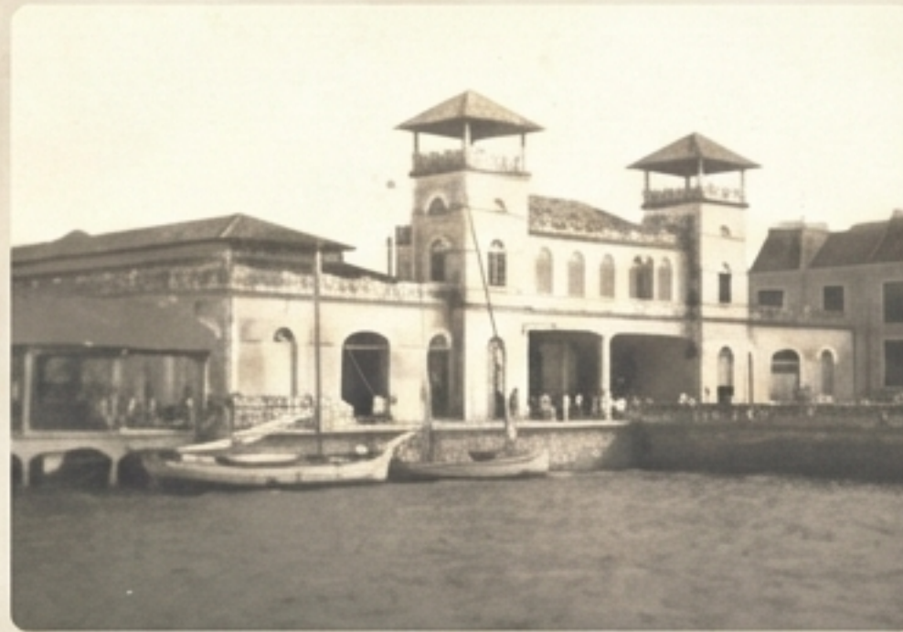
O Mercado Público visto da água, um centro vital da vida da cidade.