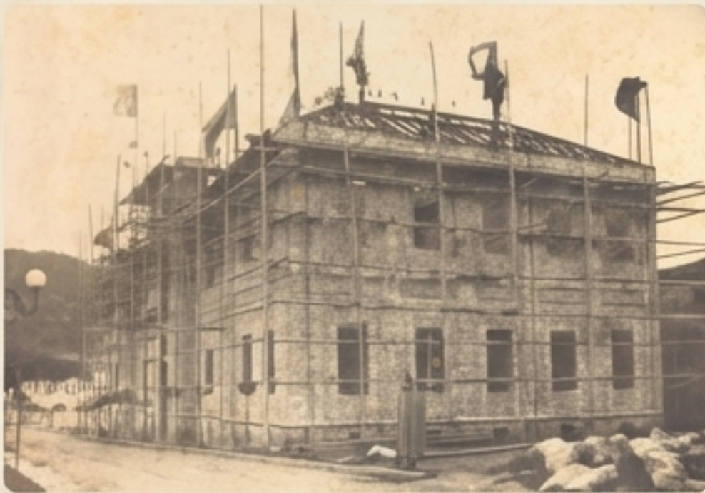
Construção de um prédio histórico, mostrando os andaimes e a cidade ao redor no início do século XX.

As fotografias documentam o crescimento e a evolução de Florianópolis e de outras cidades catarinenses, registrando edifícios icônicos, praças e ruas em diferentes épocas.