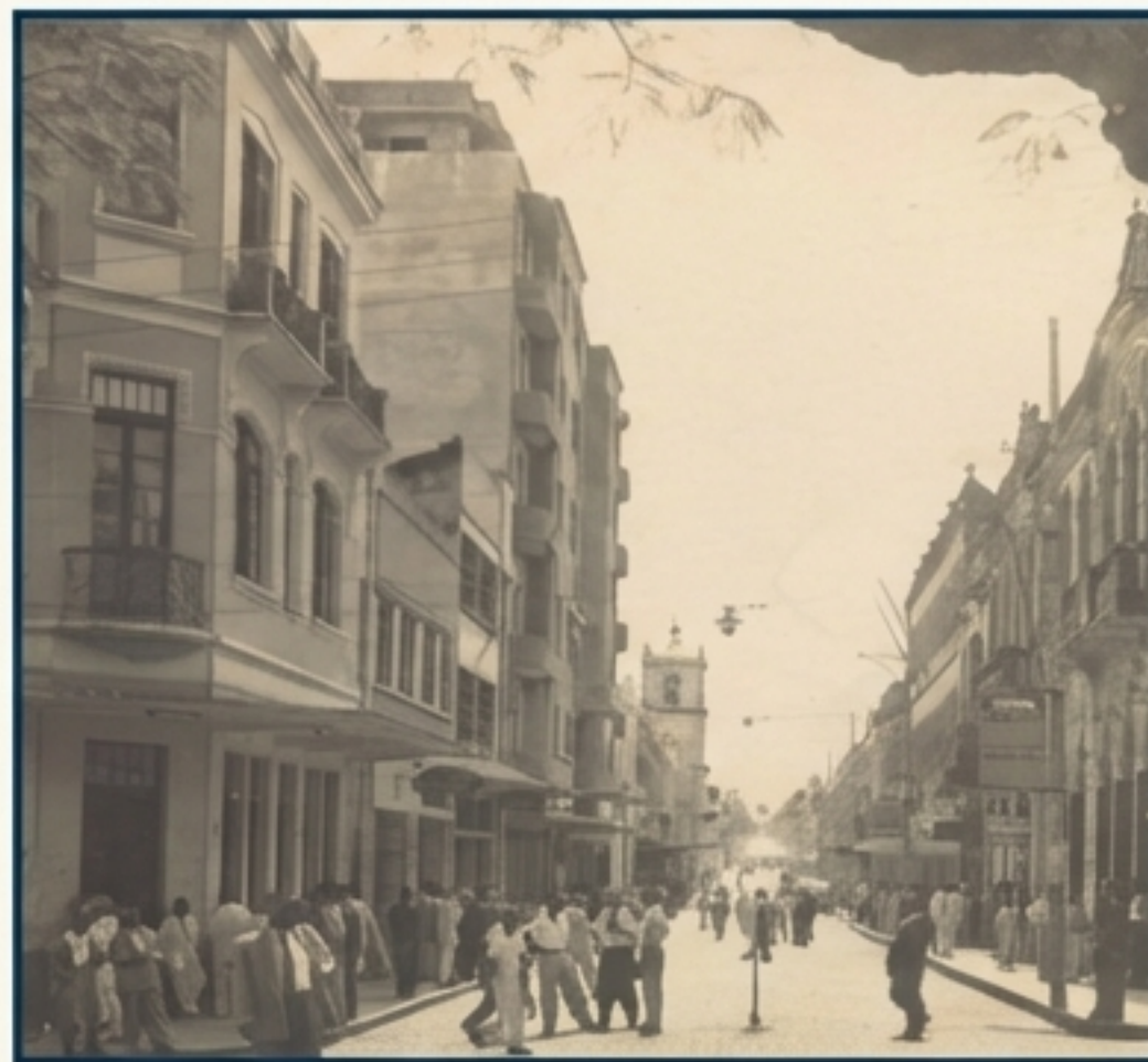
Uma rua movimentada no centro da cidade, com o antigo cinema Odeon ao fundo.