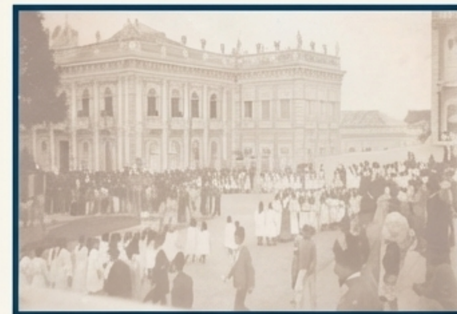
A inauguração da reforma do Palácio Cruz e Sousa, com a população reunida em 1898.