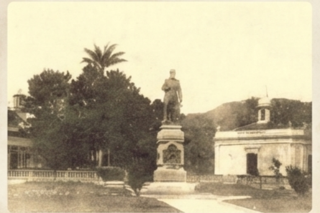
A Praça Fernando Machado (atual Praça XV de Novembro) em seu desenho do início do século XX.