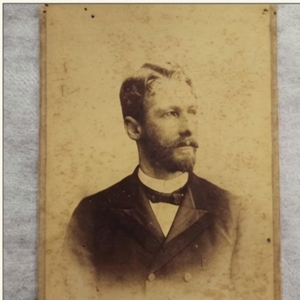
Um retrato raro do ex-governador Felipe Schmidt aos 33 anos, em 1893. Uma imagem que desafia a percepção comum que temos dele.

O acervo é um portal para o passado, revelando as figuras históricas em momentos inesperados e com uma profundidade surpreendente.