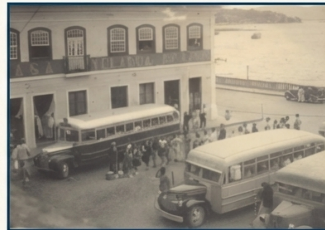
A chegada dos primeiros ônibus à cidade, em frente à Casa Yolanda.