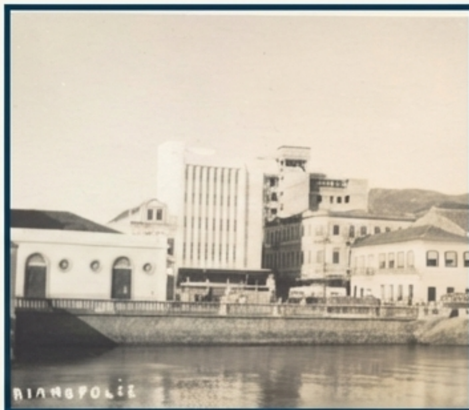
Vista do centro de Florianópolis, destacando a Alfândega.