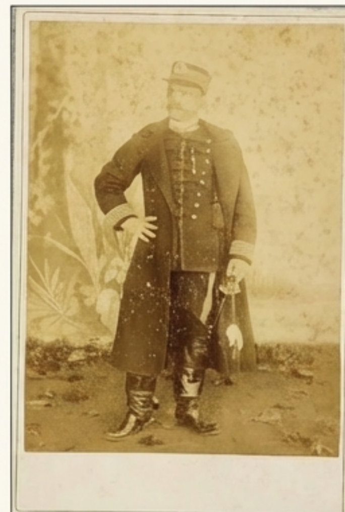
Coronel Caldeira, fuzilado no Massacre de Anhatomirim em 1894, um trágico episódio da história catarinense.