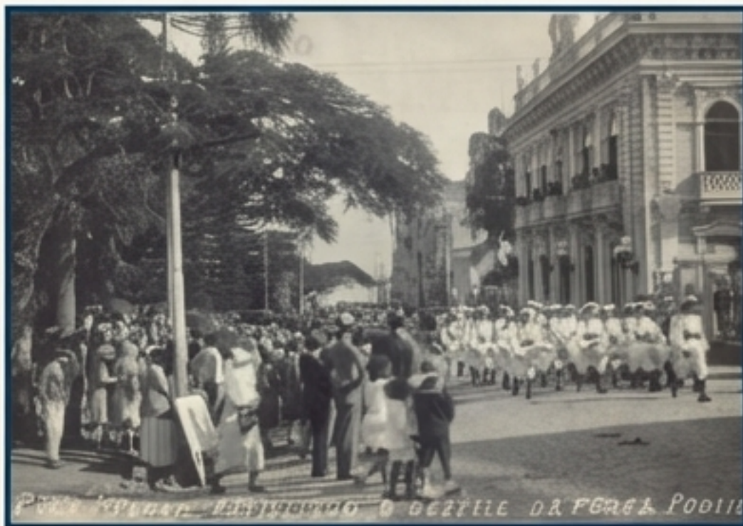
O Presidente Konder assistindo ao desfile da Força Pública, um registro do fervor cívico da época.

Para além dos retratos oficiais e das vistas panorâmicas, as imagens capturam a efervescência da vida cotidiana, os eventos cívicos e os encontros que formaram o tecido social catarinense.